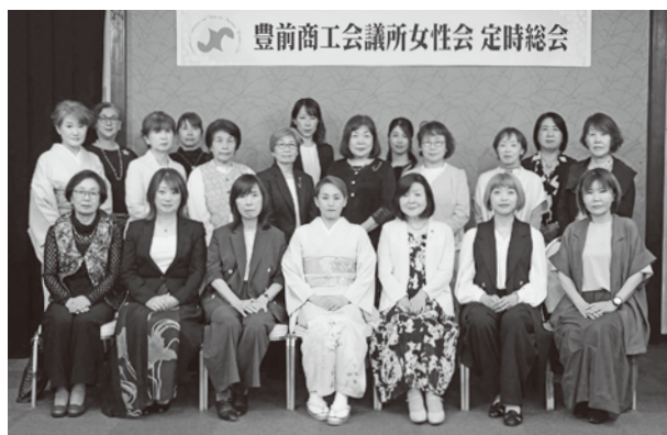
女性会定時総会での記念写真