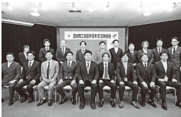
青年部定時総会での記念写真

市民の皆様はじめ、関係者の皆様には、これからも、青年部活動にご支援を賜りますようお願いいたします。